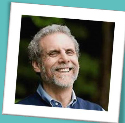
Daniel Goleman Inteligencia Emocional