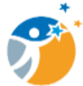
Colegio Dagoberto Godoy RED CRECEMOS