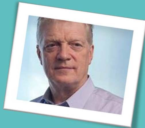
Ken Robinson Tendencias creativas