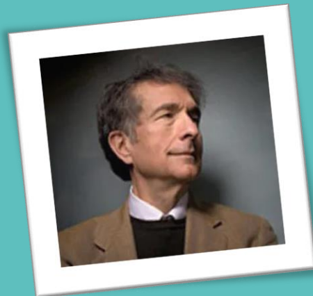
Howard Gardner Inteligencias múltiples