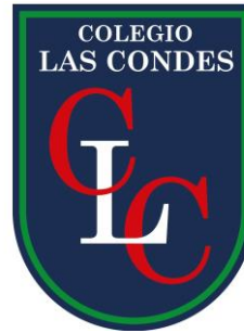
COLEGIO LAS CONDES